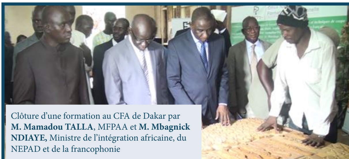
Clôture d'une formation au CFA de Dakar par M. Mamadou TALLA , MFPAA et M. Mbagnick NDIAYE , Ministre de l'intégration africaine, du NEPAD et de la francophonie

L'Office national de formation professionnelle a enregistré une hausse des demandes de formation en agro-alimentaire, en agri-élevage et dans le domaine des mines en 2017. Les formations du tertiaire occupent cependant la première place. Celles-ci s'inscrivent, avec un avantage comparable, dans une logique de