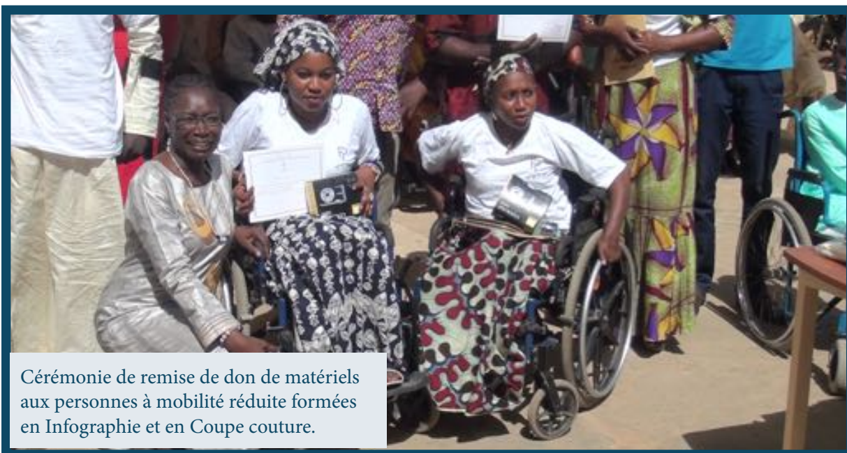
Cérémonie de remise de don de matériels aux personnes à mobilité réduite formées en Infographie et en Coupe couture.

En 2017, L'OnFp a mobilisé 212 opérateurs agréés sur les 323, soit un taux de 66% des opérateurs agréés pour réaliser ce résultat. A rappeler que la mobilisation d'un opérateur dépend de plusieurs critères dont la compétence, la proximité et la disponibilité. Sur l'ensemble des opérateurs agréés, 59% sont de Dakar et les 41% répartis entre les 13 autres régions du pays.